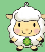
フジサワ名店ビル イメージキャラクター めえたん